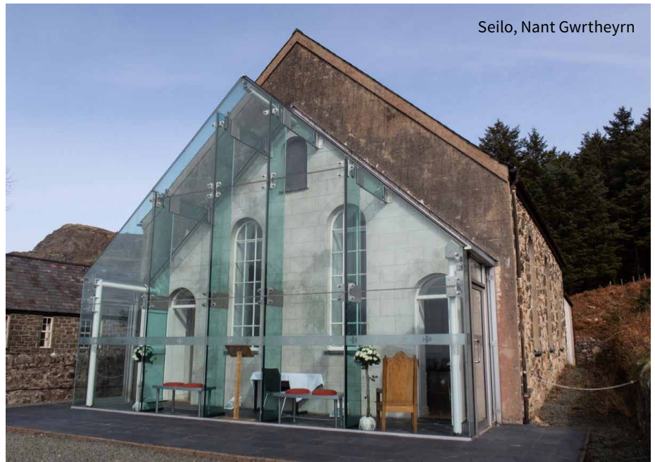
Seilo, Nant Gwrtheyrn

Tan yn ddiweddar roedd capel gan y Bedyddwyr yn y pentref hefyd, sef Tabor, ond bellach mae'r capel hwnnw wedi ei werthu i bobl leol, sydd wedi ei droi'n gartref hyfryd, gan gadw rhan o'r capel yn ei gymeriad gwreiddiol, a rhoi gofod i rywun gyfarfod yno petai galw. O ddilyn y llwybr troellog o Lithfaen tuag at y môr, down at hen bentref Nant Gwrtheyrn. Yno, caewyd capel Seilo flynyddoedd maith yn ôl pan adawyd y pentref yn adfail. Ond, wrth agor canolfan iaith yno, adferwyd adeilad y capel i'w holl ogoniant, a bellach gweinyddir degau o briodasau yno bob blwyddyn. Dros y blynyddoedd diwethaf defnyddiwyd y cyfleusterau hynny gan Undeb yr Annibynwyr a'r Bedyddwyr ar gyfer cynnal eu cyfarfodydd blynyddol.