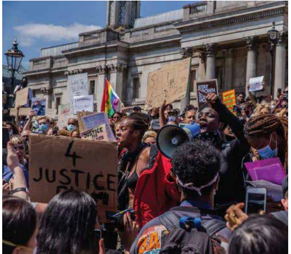
Un o'r protestiadau a welwyd yn America yn dilyn marwolaeth George Floyd ym Mai 2020