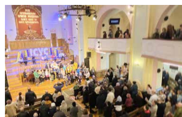
Dathlu Sul y Blodau yn Eglwys y Bedyddwyr, Lviv