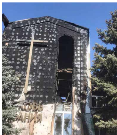
Eglwys Fedyddiedig Bethany yn Mariupol wedi'r bomio diweddar