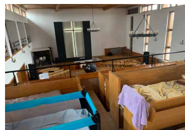
Eglwys Bedyddwyr Chelm yn defnyddio'r adeilad i letya ffoaduriaid