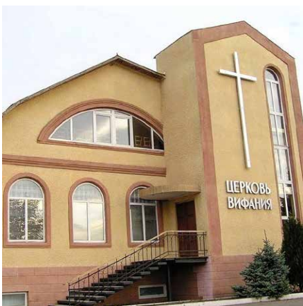
Eglwys Fedyddiedig Bethany yn Mariupol cyn y dinistr

Mi fyddaf yn mynd i Balaton yn ystod mis Mai, ac yn gobeithio cyfarfod rhai o'r arweinwyr hyn sy'n gweithio mor ddiwyd. Fe fydd mwy i'w rannu yn Cenn@d bryd hynny, gobeithio.