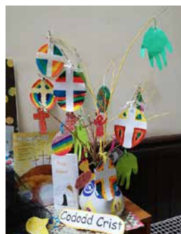
Coeden Basg Llan Llanast y Pasg