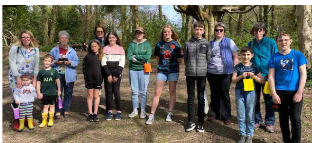
Helfa Wyau ym Mharc Penglais