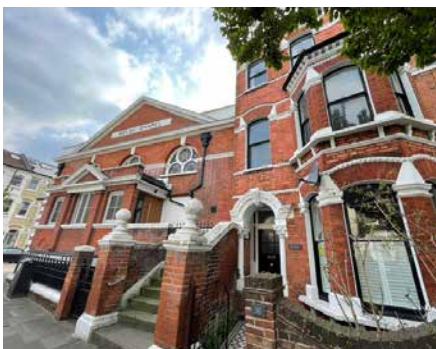
Capel Cymraeg Clapham

I gloi, mae cyfnod cyffrous iawn o'n blaenau yma yn Llundain ac edrychwn ymlaen at y daith yng nghwmni Miriam. Boed bendith Duw ar ei gwaith a boed i'r Arglwydd ei chynnal a'i harwain i'r dyfodol.