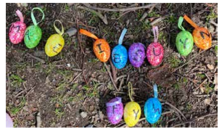
Llythrennau ar yr wyau yn ffurfio'r adnod MAE IESU YN FYW