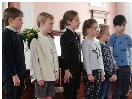
Y plant fu'n cymryd rhan yn y gwasanaeth