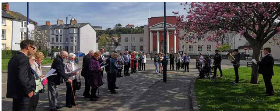
Gwasanaeth Pasg yn yr ardd