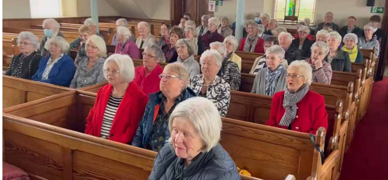
Y gynulleidfa yng nghapel Disgwylfa, y Gaerwen