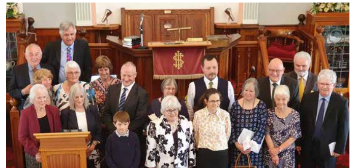
Y rhai gymerodd ran yn yr oedfa sefydlu