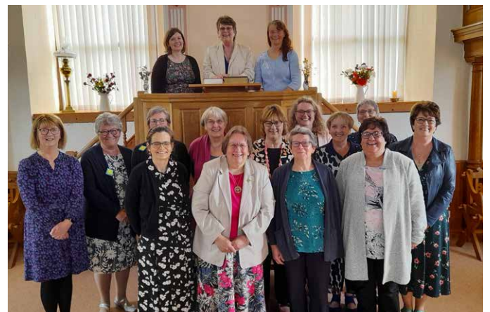
Y merched a gymerodd ran yn yr oedfa