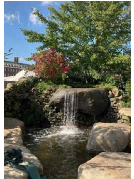
Gardd Salm 23 yn Sioe Flodau Chelsea Medi 2021

Swyddog Hyfforddiant a Datblygu De Cymru, Agor y Llyfr