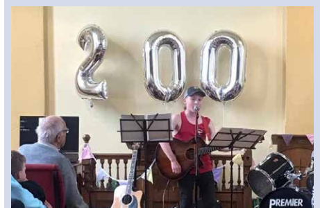
(Cynhaliwyd diwrnod i'r teulu eisoes yn ystod Gorffennaf - gweler y llun)

Croeso cynnes i bawb Cyfle i ddiolch am 200 mlynedd o dystiolaeth Gristnogol.