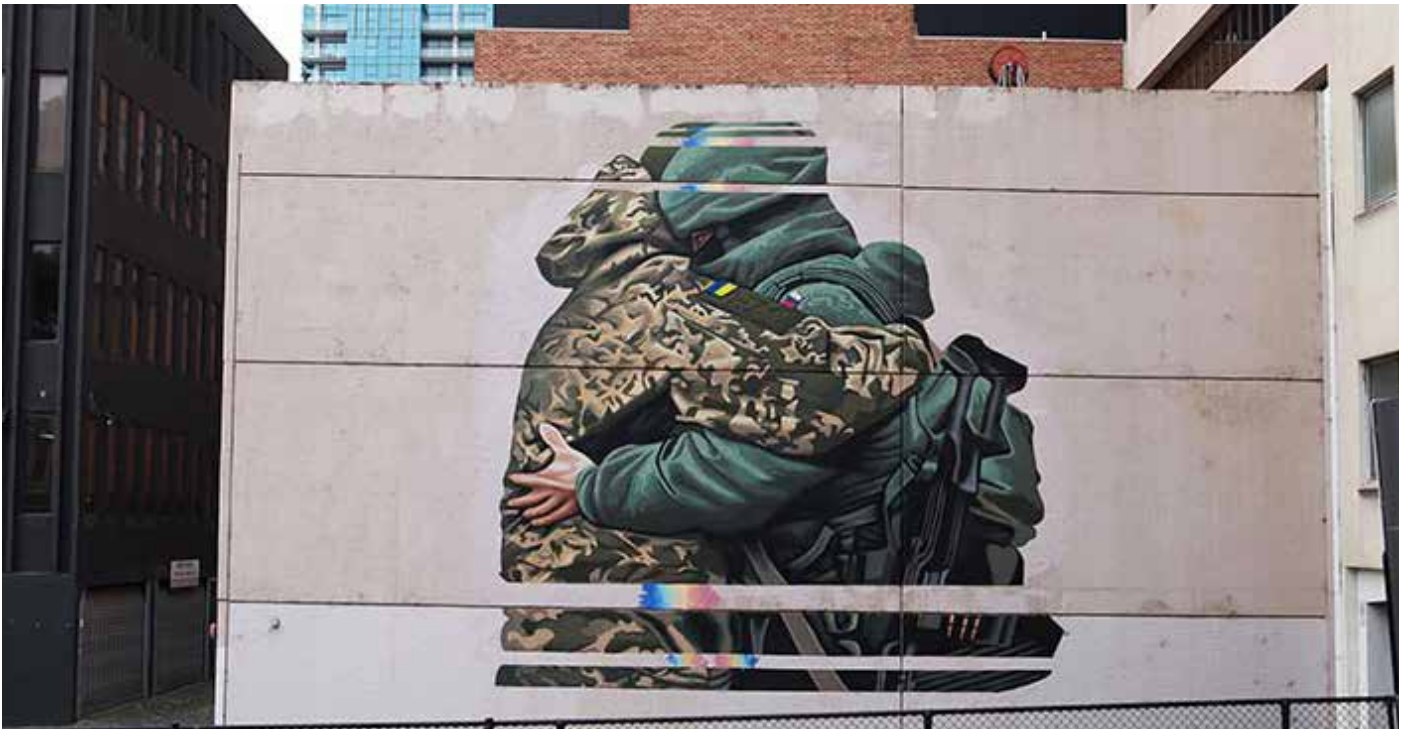
Llun: gyda chydnabyddiaeth i'r artist, Peter 'CTO' Seaton.

Os gallwch chi weld y darlun sy'n cael ei ddangos ar y dudalen hon – yn o ddau filwr yn cofleidio, yna fe allwch weld yr hyn a achosodd dramgwydd mawr i lysgennad Wcráin a'r gymuned Wcreinaidd yn Melbourne ym mis Medi pan gafodd ei beintio ar wal wag yno.