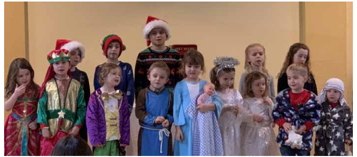
Gwasanaeth Nadolig Pencaenewydd

Am y tro cyntaf mewn tair blynedd llwyddwyd i gynnal tri gwasanaeth yn cynnwys Drama'r Geni yn yr ofalaeth hon. Cafwyd sawl te parti efo ymweliad gan Siôn Corn, gwasanaeth carolau yng nghwmni plant yr ysgol leol a chyfle i ganu carolau o gwmpas y pentref. Er gwaethaf pob ymdrech dros y ddwy flynedd ddiwethaf i ffilmio oedfaon, postio anrhegion ac anfon bwyd parti mewn boc, a chydfwyta ar Zoom, roedd rhywbeth yn chwithig yn y dathliadau ynysig hynny. Wrth fodio drwy dudalennau ar Facebook nos Sul diwethaf, cysur mawr oedd gweld lluniau lliwgar o olygfeydd y Geni ac ambell ymddangosiad gan Siôn Corn mewn capeli ar hyd a lled Cymru. Ie, heb os, mae'r Nadolig yn gyfnod pan fyddwn ni'n cael pleser a boddhad o weld wynebau'r plant yn ymateb i ryfeddod yr ŵyl. Diolch am bob un plentyn sy'n rhan o fywyd a gweithgarwch ein heglwysi.