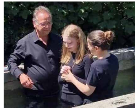
Bedydd Ebenezer, Dyfed