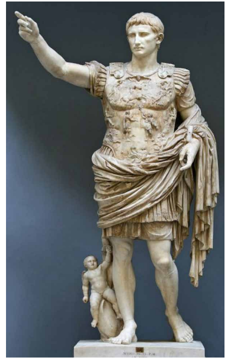
Cesar Augustus, Amgueddfa'r Fatican

Peidiwch ag ofni – Mae'r Arglwydd yn dweud y bydd yn ysgwyd y cenedloedd er mwyn i'w trysor ddod i mewn i lenwi'r deml newydd â gogoniant. Daeth llawer o drysor drwy Cyrus ac fe godwyd y deml. Ond hefyd mae hon yn broffwydoliaeth