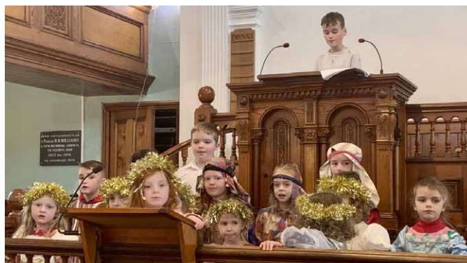
Gwasanaeth Nadolig Chwilog