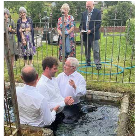
Bedyddio ym Methel, Silian

Dim ond dwy ymhlith llawer yw'r straeon hyn. Ond yr hyn sydd ganddyn nhw i gyd yn gyffredin yw'r ffaith fod yr Ysbryd Glân yn parhau i fod ar waith yn ein gwlad, gan alw pobl i ddilyn Iesu.