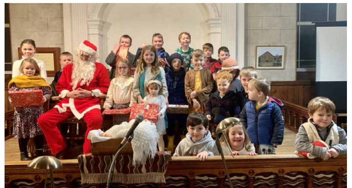
Plant Ysgol Sul capel Llwyndyrys gyda Siôn Corn

Ond cofiwn yr un pryd nad 'rhywbeth ar gyfer y Dolig yn unig' yw plant. Gwn am rai capeli aeth allan i chwilio am blant er mwyn cynnal oedfa yn eu cwmni dros y Nadolig, ond nad oes unrhyw ddarpariaeth arall yno ar eu cyfer gweddill y flwyddyn. Os llwyddwyd i gynnull y plant ynghyd eleni, beth am adeiladu