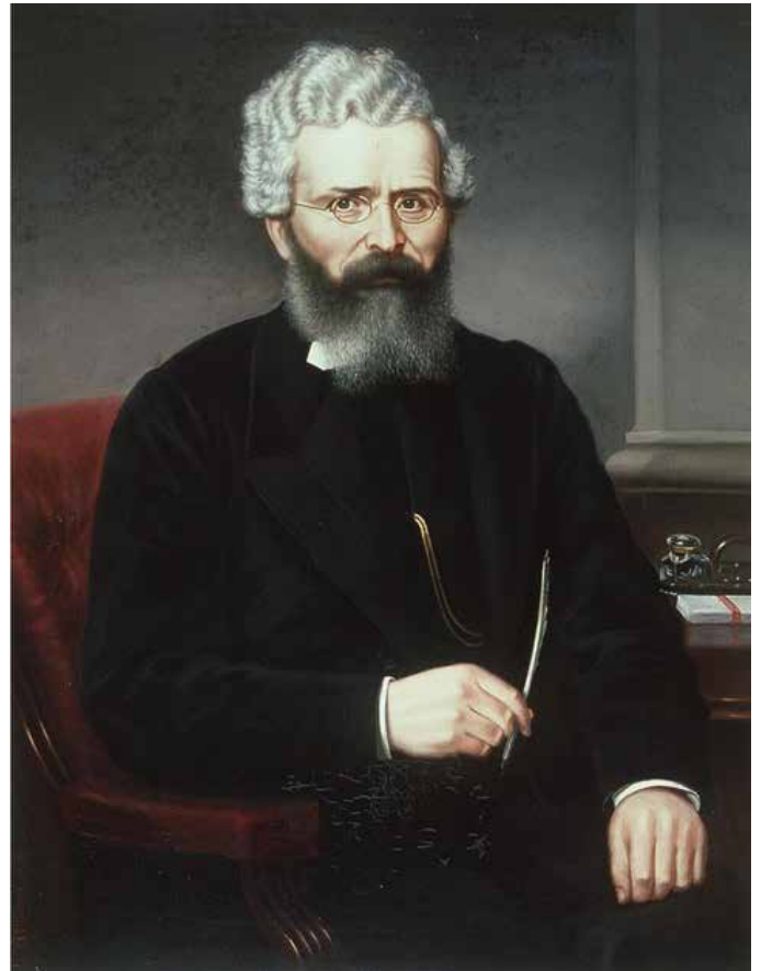
Llun: Paentiad o leuan Gwyllt gan Evan Williams. Llyfrgell Genedlaethol Cymru

Roedd yn adeg dda i hyrwyddo gwelliant yn y canu. Digon amrwd, yn ôl adroddiadau'r cyfnod, oedd llawer o ganu cynulleidfaol y capeli, gyda phobl yn mynd allan o'r capel wedi'r bregeth tra oedd rhyw ran arall o'r gynulleidfa wrthi'n canu pennill. Tonau blodeuog ac ailadroddus oedd llawer o'r tonau. Hefyd, wedi cynnwrf Diwygiad 1859, roedd cynulleidfa oedd yn lluosogi, ac erbyn yr 1860au roedd yr enwadau yn dechrau mynd yn fwy ffurfiol a 'pharchus'. Felly, am resymau o drefn yn ogystal â rhesymau cerddorol, roedd awydd i wella'r canu. A choron ar y cyfan oedd datblygu'r gymanfa ganu yn offeryn er lles caniaadaeth, symudiad a hyrwyddodd leuan yn egniol.