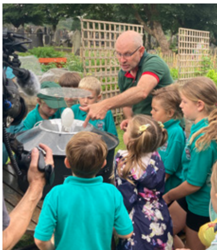
Mike Dilger a'r plant yn archwilio'r trap gwyfynod

Daeth Mike Dilger, yr ecolegydd a chyflwynydd y rhaglen Sunday Morning Live ar y BBC, i Eglwys Sant Samlet, Abertawe, fis Gorffennaf i gael gwybod am bwysigrwydd gofalu am natur a beth mae'r cynllun Eco Eglwys yn ei olygu i Gristnogion lleol. Cafodd y bennod ei darlledu ddydd Sul, 20 Awst, ar BBC1. Roedd y bennod yn cyfleu pwysigrwydd ailgysylltu â'r byd naturiol a thrawsnewid lleoedd er lles natur.