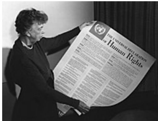
Eleanor Roosevelt yn dal copi o'r Datganiad o Hawliau Dynol yn 1949

Eleni, wrth inni nodi 75 mlynedd ers sefydlu Cyngor Eglwysi'r Byd a chyhoeddi'r Datganiad Cyffredinol, mae pwyllgor canolog y Cyngor yn cydnabod y gwerthoedd a rennir ac sy'n sail i'r ddau beth. Yr un pryd, rydym yn cydnabod y ffyrdd a'r manau niferus lle mae rhodd Duw o urddas dynol yn cael ei bygwth a'i pheryglu. Gwelwyd rhyddid yn cael ei ormesu mewn modd cynyddol awdurdodol, yn ogystal â gwrthdaro, meddiannaeth a dadleoli gorfodol. Ceir enghreifftiau o wahaniaethu a rhagfarn, erledigaeth, anghydraddoldeb economaidd rhemp a thlodi eithafol parhaus. Cynyddodd eithafiaeth