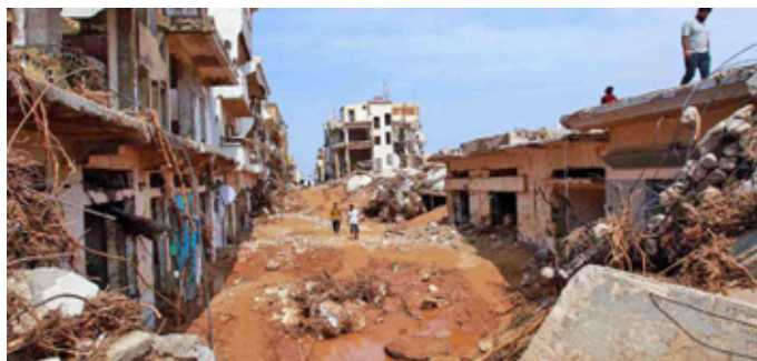
Pobl yn archwilio ardal wedi'i difrodi gan lifogydd dirybudd yn Derna, dwyrain Libya, 11 Medi 2023

“Mae partner Cynghrair ACT Cymorth Cristnogol, Dan Church Aid o Ddenmarc, wedi sefydlu presenoldeb yn Libya ers 2011, ac mae bellach yn helpu gyda'r ymateb brys. Mae staff DCA yn nwyrain y wlad yn cynorthwyo Cilgant Coch Libya yn Derna ei hun, yn benodol gyda chymorth meddygol i'r timau chwilio ac achub. Mae staff logisteg a staff maes DCA yn caffael eitemau sylfaenol ar gyfer y llochesi er mwyn helpu teuluoedd sy'n cyrraedd yno'n waglaw.