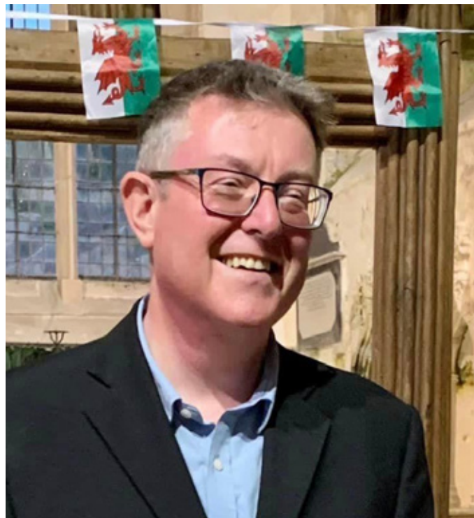
Siôn Brynach yng Nghlynnog

Y siaradwr allweddol cyntaf oedd Sviatlana Tsikhanouskaya, sef arweinydd yr wrthblaid yn Belarus wedi i'w gwâr, Siarheu, a fu'n arweinydd cynt, gael ei arestio gan unben Belarus, Aleksandr Lukashenko. Fe siaradodd hi'n ddirdynol am y sefyllfa yn Belarus yn dilyn y gwrthryfel heddychlon a ddigwyddodd yno